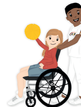
Recht auf Fürsorge und Förderung bei Behinderung..