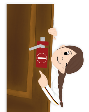
Recht auf Privatleben..