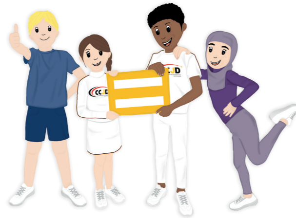
Gleiches Recht für Alle..