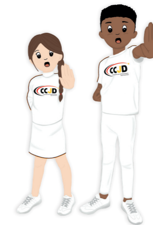
Recht auf gewaltfreie Erziehung (Recht auf Selbstbestimmung)..