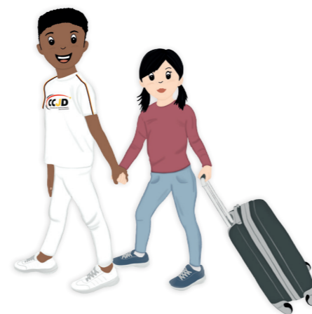
Recht auf Schutz im Krieg und auf der Flucht..