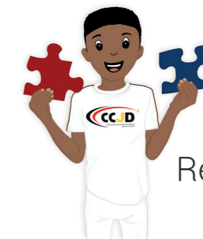
Recht auf Spiel und Freizeit..