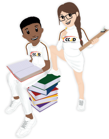
Recht auf Bildung..