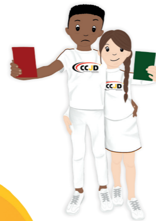
Recht auf Beteiligung..